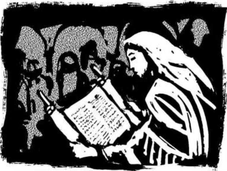
Jezus in de synagoge te Nazareth