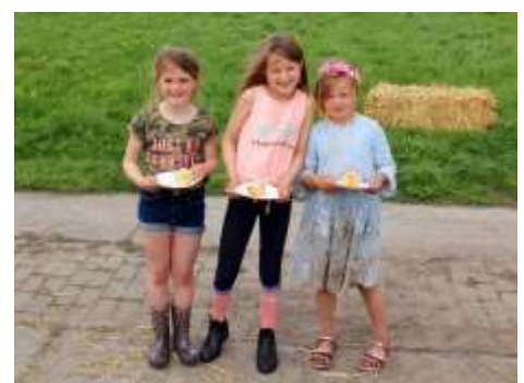
Het was genieten!