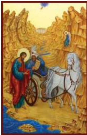
Filippus en de kamerling, Hand. 8

Heb je nou net als de kamerling uit het Bijbelverhaal in Handelingen 8, en dat was 2000 jaar geleden, dat als je de bijbel leest, je net als hij met vragen zit zoals: wat wordt er nou precies bedoeld? Zou je weleens meer willen weten over de bijbel? Hoe zit die bijbel in elkaar en hoe zit het met het oude en nieuwe testament? Wat is de geschiedenis van de kerk en waarom zijn er in de loop van de tijd allerlei dogma's ontstaan? Welke vragen kom je tegen bij ethiek en filosofie? En hoe zit het met al die variaties in de liturgieën van de verschillende kerken? Deze en nog veel meer vragen komen aan de orde in de cursus