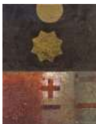
Zieken bezoeken door Jeltje Hoogenkamp